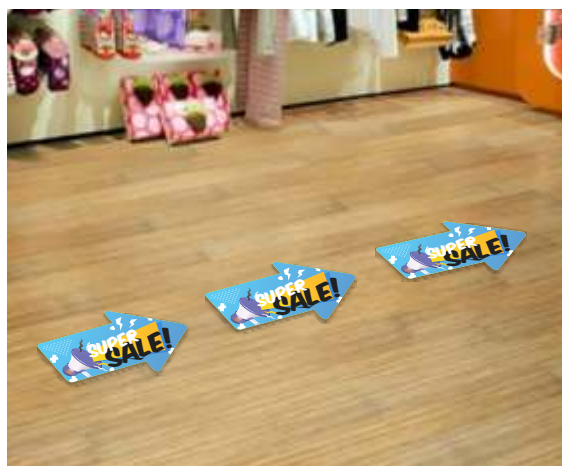
Ilustração do produto