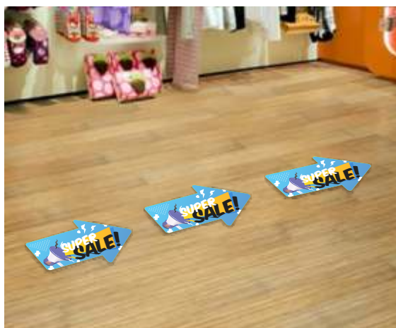
Ilustração do produto