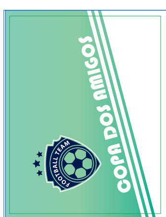
Página 01 Impressão