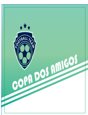
Página 01 Impressão