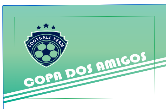
Página 01 Impressão