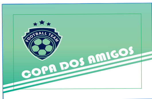
Página 01 Impressão