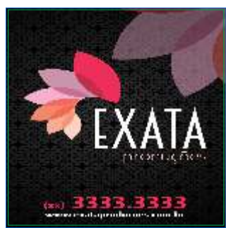
Página 01 Impressão Frente