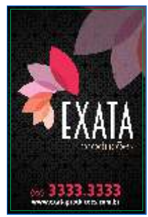
Página 01 Impressão Frente