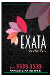
Página 01 Impressão Frente