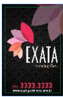
Página 01 Impressão Frente