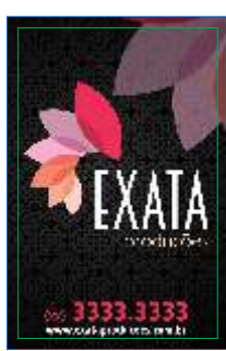
Página 01 Impressão Frente