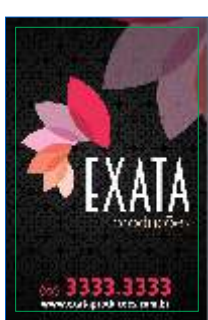
Página 01 Impressão Frente