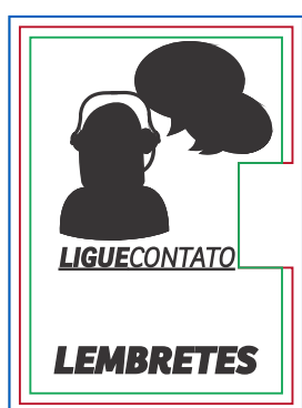
Página 02 Máscara de Tinta Branca