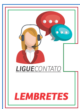
Página 01 Impressão