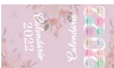
Apague as linhas do gabarito da arte