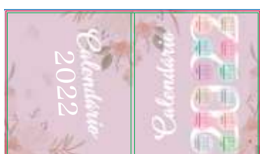
Página 01 Impressão