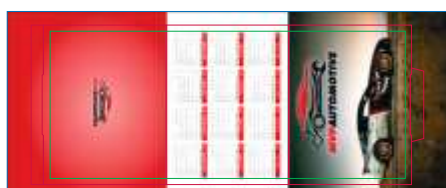
Página 01 Impressão