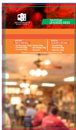
Página 01 Impressão