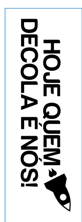
Página 01 Impressão do Copo Envie sua arte em preto (100%K) vetorizada

Modelo de compra sem personalização no abridor.