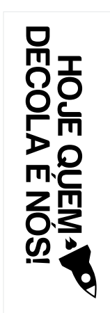
Antes de Gerar o arquivo em PDF/X1-a para impressão, exclua todas as linhas do gabarito.