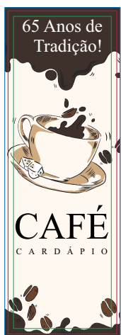
Página 01 Impressão Frente