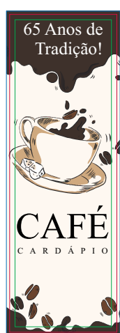
Página 01 Impressão Frente