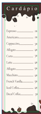
Página 02 Impressão Verso