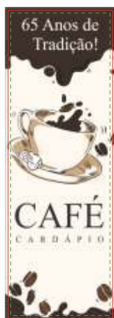
Página 01 - Frente