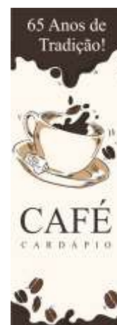
Página 01 - Frente

Faça sua arte sempre respeitando as margens de segurança, corte e acabamento.