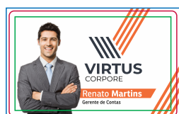
Página 01 Frente