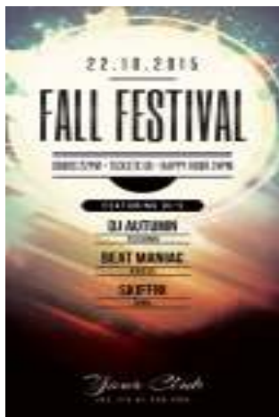
Página 01 (Impressão Frente)