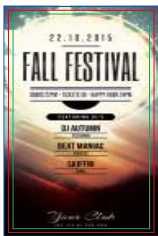
Página 01 Impressão