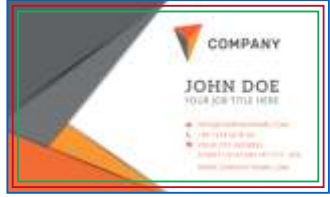
Página 01 Frente