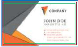
Página 01 Frente