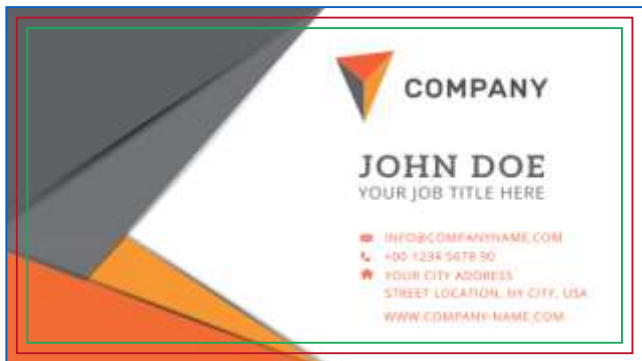
Página 01 Impressão