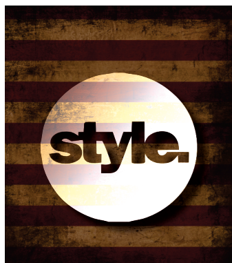
PÁGINA 1 - FRENTE