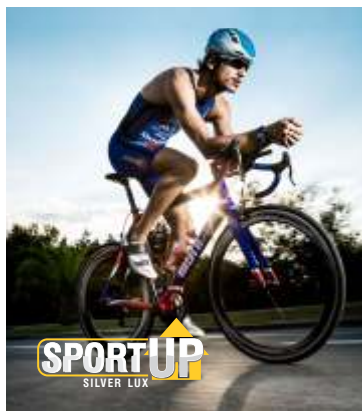
Página 01 (Impressão Frente)

Veja abaixo como montar a sua arte para envio do seu arquivo