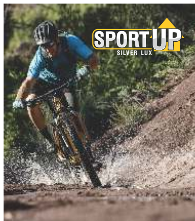
Página 2 (Verso)