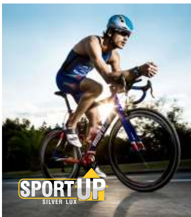
Página 1 (Frente)