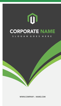
APAGUE TODAS AS INFORMAÇÕES DO GABARITO ANTES DE GERAR O ARQUIVO PDF/X1-A PARA IMPRESSÃO