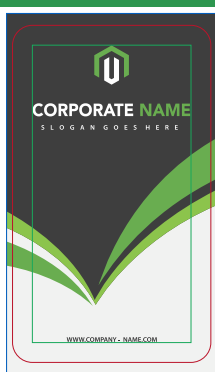
Página 01 Impressão