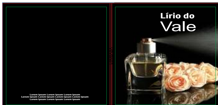
Página 1 (Contra Capa e Capa)