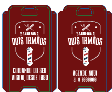
Página 01 Impressão