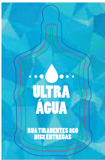
PAG 1: FRENTE