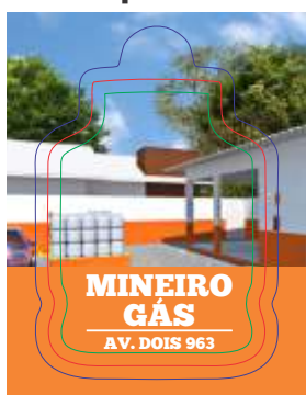
PAG 1: FRENTE