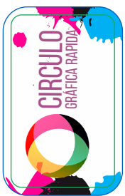
Página 1 (impressão Frente)