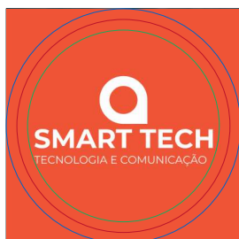
PAG 1: FRENTE