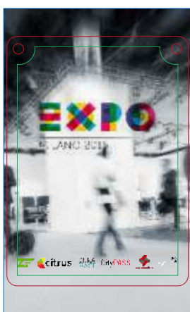
Pagina 01 Impressão