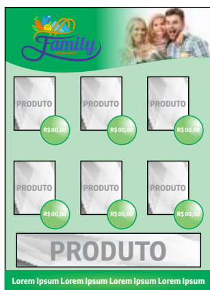
Página 1 - Frente