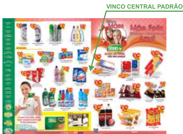
Página 02 (Verso)

Encartes e Jornais 4x4 devem ser enviadas com 2 páginas contendo a frente e o verso do serviço/impressão.