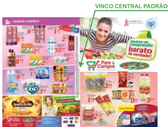
Página 01 (Frente)

Veja o modelo abaixo para montagem do seu arquivo: