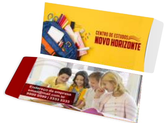
Modelo do produto final