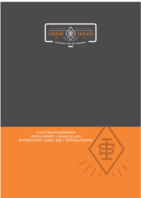
Antes de gerar o arquivo em PDF/X1-a exclua as margens de sangria, corte e segurança.