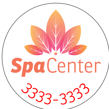
Página 1 - Frente