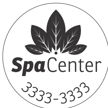
Página 2 - Máscara de Tinta Branca