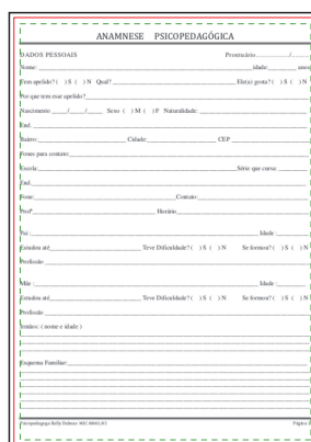
Página 01 - Frente