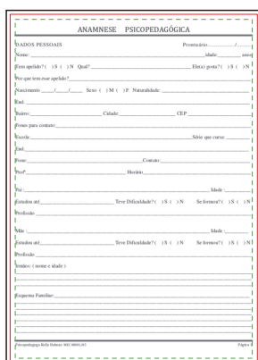
Página 01 - Frente