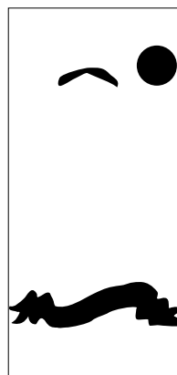
Página 4 - Verniz Verso 100% preto e em vetor

***Caso seu arquivo possua verso, basta adicionar um páginas nas mesmas especificações da primeira***