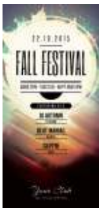
Página 1 - Frente