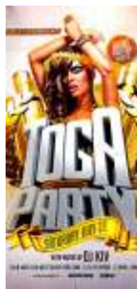
Página 3 - Verso