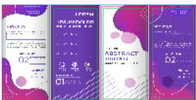
PÁGINA 2 (Verso)