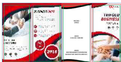
PÁGINA 1 (Frente)