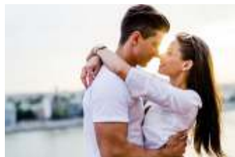
Página 3 (Foto 3)