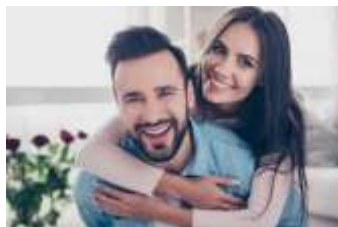
Página 2 (Foto 2)