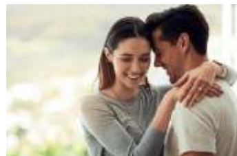
Página 4 (Foto 4)

Obs.: :: O arquivo deve ser enviado com a quantidade de páginas de acordo com a quantidade comprada