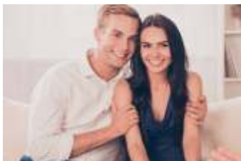
Página 1 (Foto 1)