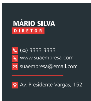
Página 1 - Frente