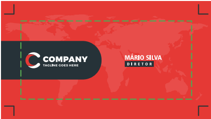
Página 01 (Frente)

Artes para cartões de visita 4x0 devem conter apenas 1 página com a arte para impressão da frente.