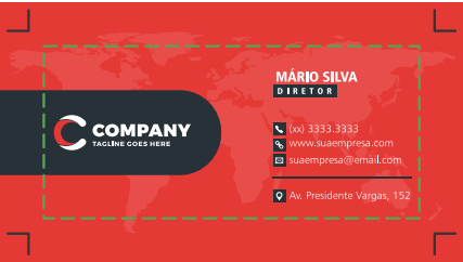
Página 01 (Frente)

Artes para cartões de visita 4x0 devem conter apenas 1 página com a arte para impressão da frente.