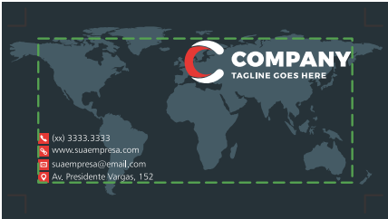
Página 02 (Verso)

Artes para cartões de visita 4x1 e 4x4 devem conter 2 páginas. Página 1: Frente, Página 2: Verso. ATENÇÃO! Artes 4x1 devem ser feitas com verso apenas em tons de cinza, outras porcentagens de cores não serão impressas.