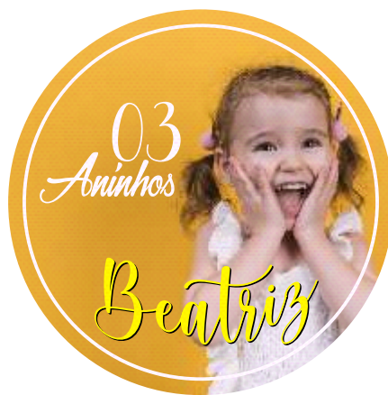
Página 1 - Frente