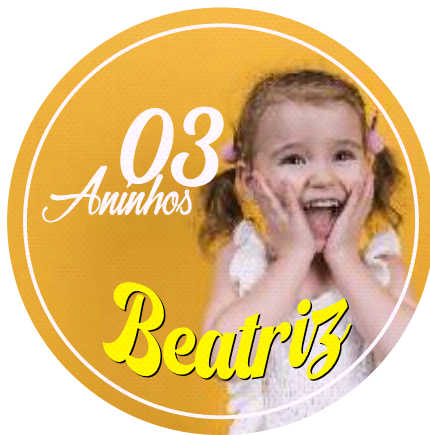
Página 1 - Frente

Veja abaixo como montar a sua arte para envio do seu arquivo