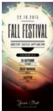
Página 01 (Impressão Frente)

***Caso seu arquivo possua verso, basta adicionar um páginas nas mesmas especificações da primeira***